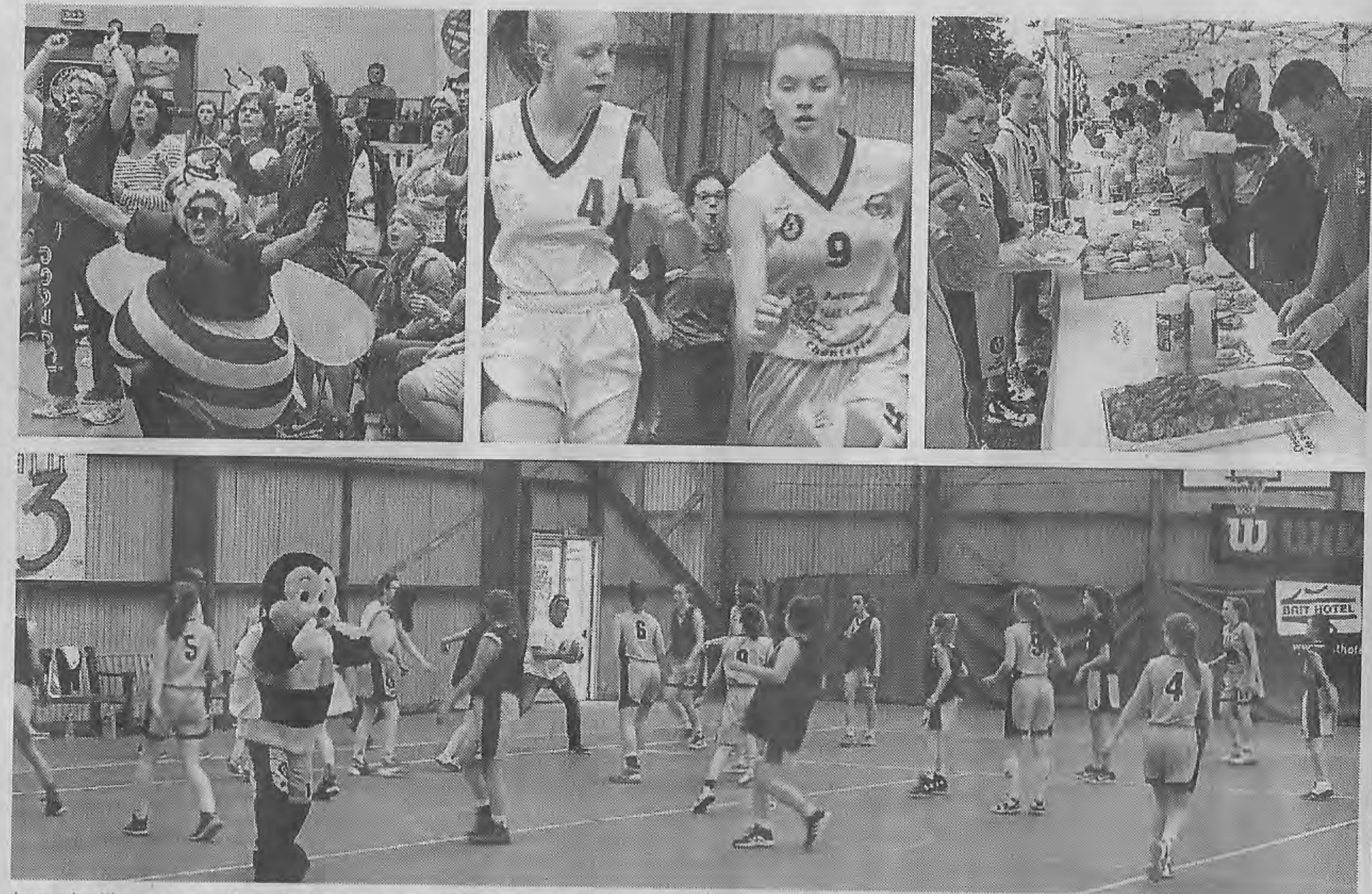
Les abeilles, mascottes du tournoi, ont donné de la voix et encouragé toutes les équipes. Duels acharnés autour du ballon. Les bénévoles n'ont pas chômé. Grand moment d'amusement et d'émotion entre les joueuses des Ententes Chantepie-Châteaugiron pour leur dernier match ensemble.

L'émotion a été également au rendez-vous, pour les joueuses et les coaches des deux équipes Entente Chantepie-Châteaugiron. Le tournoi a signé la fin de leur aventure commune, l'Entente entre les deux clubs n'étant pas reconduite la saison prochaine. Dominées dans le jeu