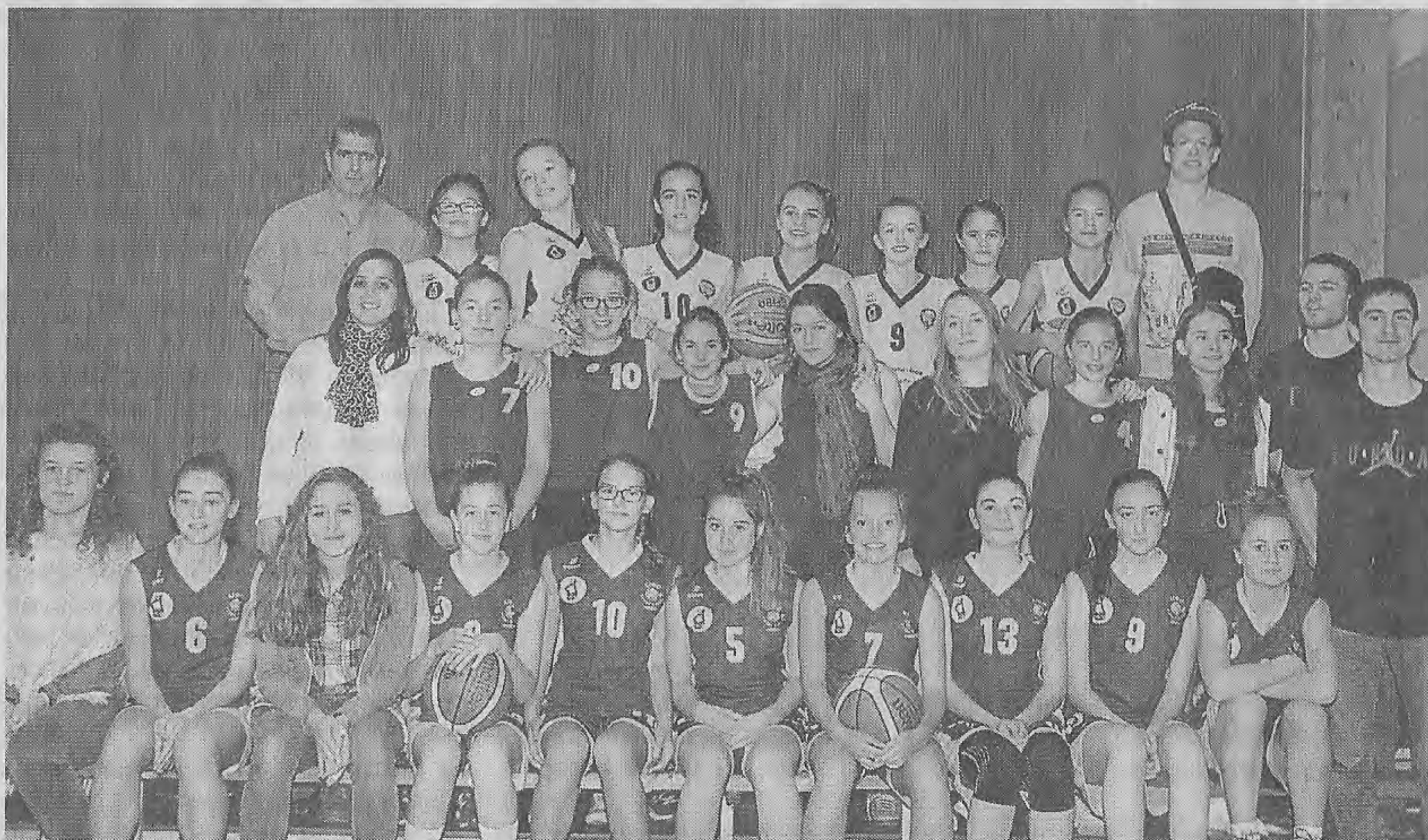
Les filles des deux équipes Entente Chantepie-Châteaugiron sont prêtes à défendre leurs chances.