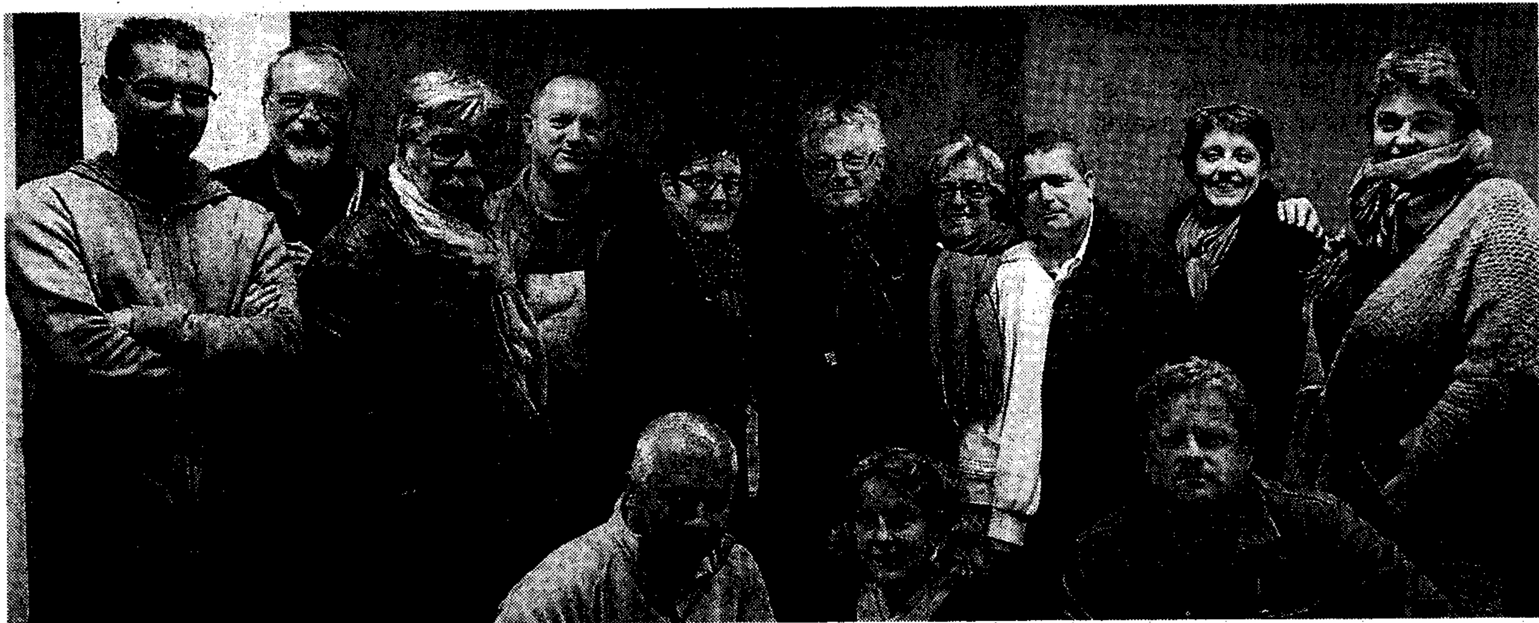
Une partie des membres du bureau de l'Organisation du tournoi international (Oti).

Les membres de l'Organisation du tournoi international (Oti) se sont réunis, jeudi, pour commencer à préparer le tournoi 2016.