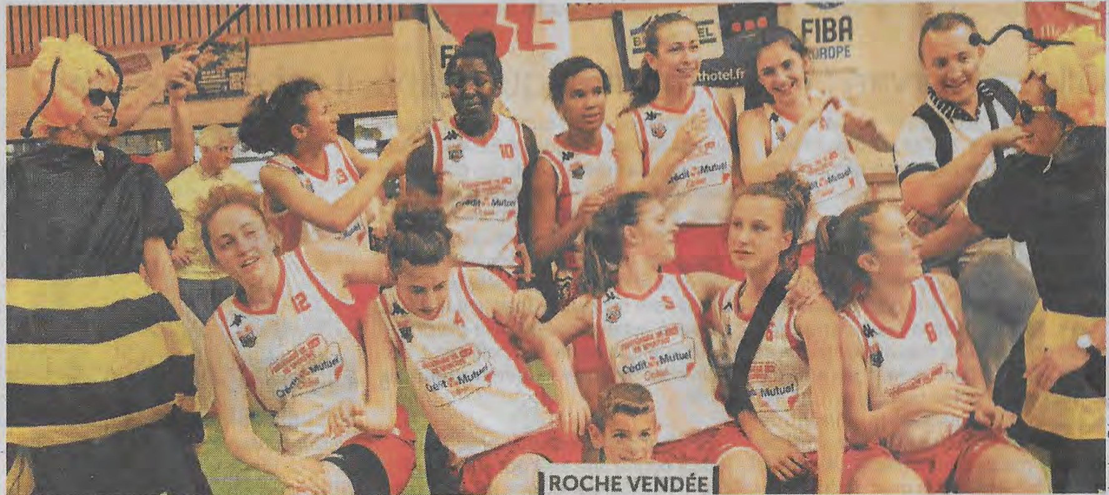
Les jeunes Vendéennes peuvent jubiler, elles ont effectué un tournoi convaincant.

Les équipes bretonnes ont été assez en vue, mais aucune n'a atteint le dernier carré, avec trois clubs qui échouent en quarts de finale. L'Avenir de Rennes, finalement cinquième du tournoi, réalise une performance à la hauteur de ce qui était attendu. La belle performance est à mettre au crédit du club de Pacé, qui joue en inter-région et termine à la sixième place. Quéven finit huitième du tournoi. Pas facile non plus pour les équipes internationales. Les joueuses de Jinan (Chine) n'ont pu rééditer la performance réalisée l'année dernière par leur équipe, en terminant douzième. Les Belges de Blégnny et de Sombreffe finissent respectivement neuvièmes et quatorzièmes, et les Tchèques de Brno se